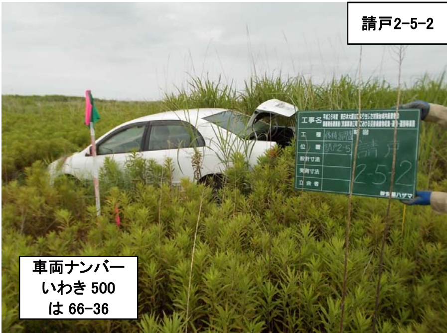
車両ナンバー いわき 500 は 66-36