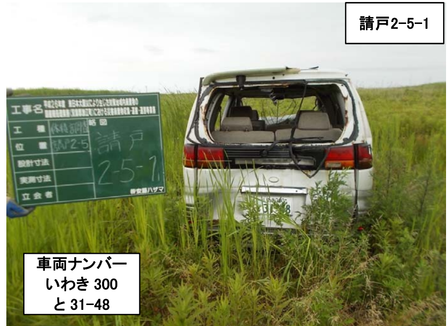
車両ナンバー いわき 300 と 31-48