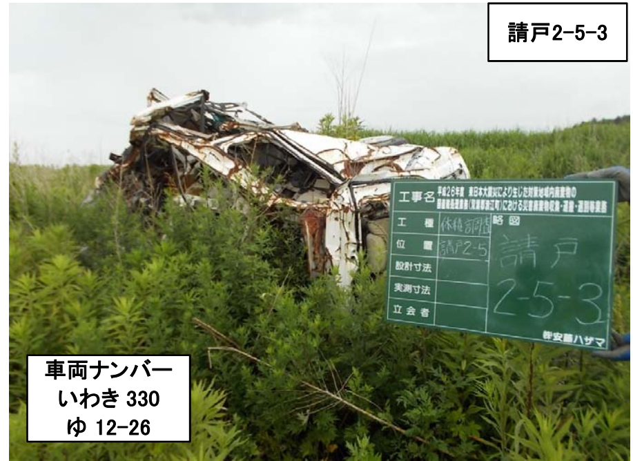
車両ナンバー いわき 330 ゆ 12-26