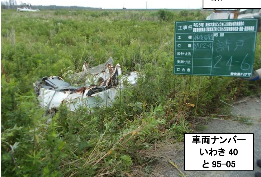
車両ナンバー いわき 40 と 95-05